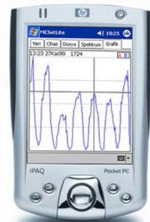
MCSetLite su Pocket PC con le impostazioni per il turco.

Lavorare con le unità MetroCount è facilissimo! L'interfaccia intuitiva di MCSetLite si apprende molto velocemente. Grazie alle unità MetroCount che memorizzano solo assi individuali, non ci sono parametri di indagine difficili da impostare. Nessuna decisione a priori per statistiche di velocità, intervalli di tempo, schemi di classificazione, ecc. La filosofia di base MetroCount è di fornire il vantaggio dell'efficienza e un utilizzo rapido!