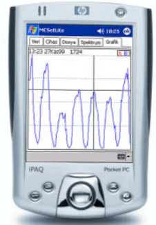
MCSetLite auf einem Pocket PC mit der Spracheinstellung für Türkisch.

Das Traffic Executive MCSetLite Modul für den Pocket PC verfügt jetzt über umfassende Sprachunterstützung. Die Menüs und Dialogfelder können in vielen Sprachen angezeigt werden. Alle Aufgaben für Felduntersuchungen wie Installation, Starten und Überwachen der Straßengeräte der MetroCount 5600 Series können von den Außendienstmitarbeitern in jeder beliebigen Sprache durchgeführt werden!